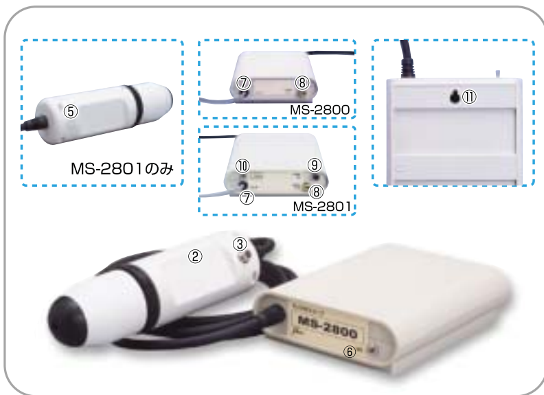
カメラ部 ①倍率レンズ ②カメラ本体 ③ストラップ口 ④カメラコード ⑤フリーズボタン 制御ユニット ⑥POWERスイッチ ⑦ACコード ⑧映像信号出力コネクタ ⑨フットスイッチ ⑩フリーズメモリー切替スイッチ ⑪制御ユニット取付穴